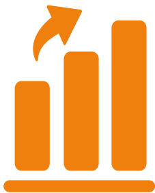
Marknadsetablering: 3 år

Från kommersiell lansering är Bolagets bedömning att det tar cirka tre år för marknadsetablering och för att penetrera marknaden till 10%, vilket är Bolagets målsättning. Utvecklingen av banbrytande medicinteknik är kostnads- och tidskrävande på grund av de regulatoriska processerna, men när produkten väl når marknaden beräknas Bolaget få lönsamhet snabbt.